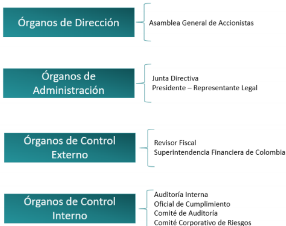
Cuadro No. 2. ÓRGANOS DE GOBIERNO DE RAPPIPAY

Así mismo, se consideran como otros órganos de Gobierno Corporativo, los órganos de control interno y órganos de control externo. En el Cuadro 2 se hace una relación de tales órganos; no obstante algunos de ellos tienen diversos roles.